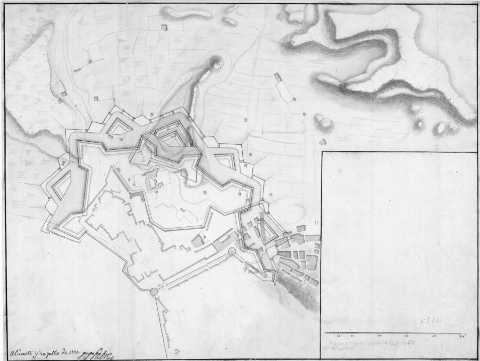
FIG. 4. «PLANO Y PROYECTO PARA LA PLAZA DE ALICANTE». DIEGO FABR . 20 DE JULIO DE 1721. SGE. CARTOTECA HIST RICA. AR G-T.3-C.3-290.

cimiento de la plaza y estudiado los diversos proyectos previos, en especial el de Fabr , habr a optado por simplificar el cintur n abaluartado de este ingeniero y reforzar las bater as de costa, la plataforma de la Ereta, y el desv o del cauce del San Blas, sin el cual las obras de fortificaci n, y en concreto el baluarte de San Carlos, resultar an seriamente da adas.